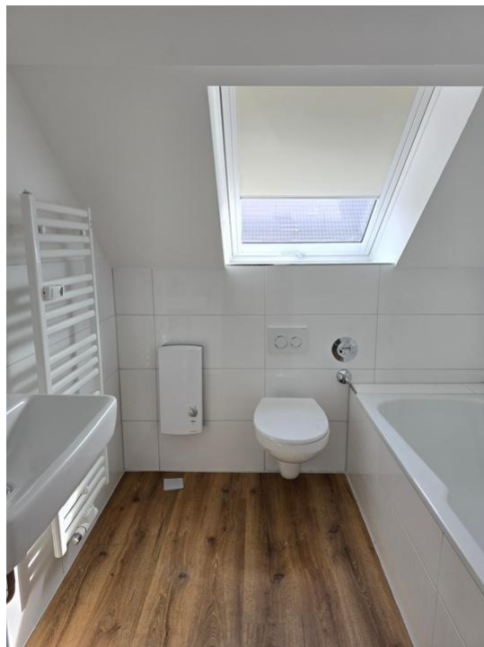
baden und pflegen