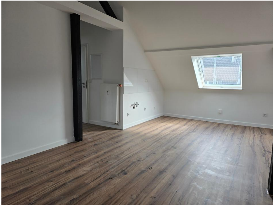
wohnen und kochen