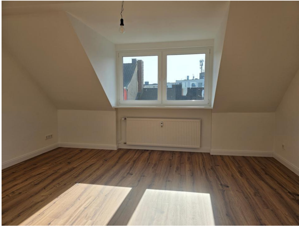
spielen oder arbeiten