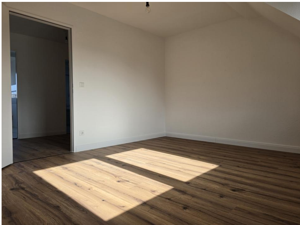
spielen oder arbeiten