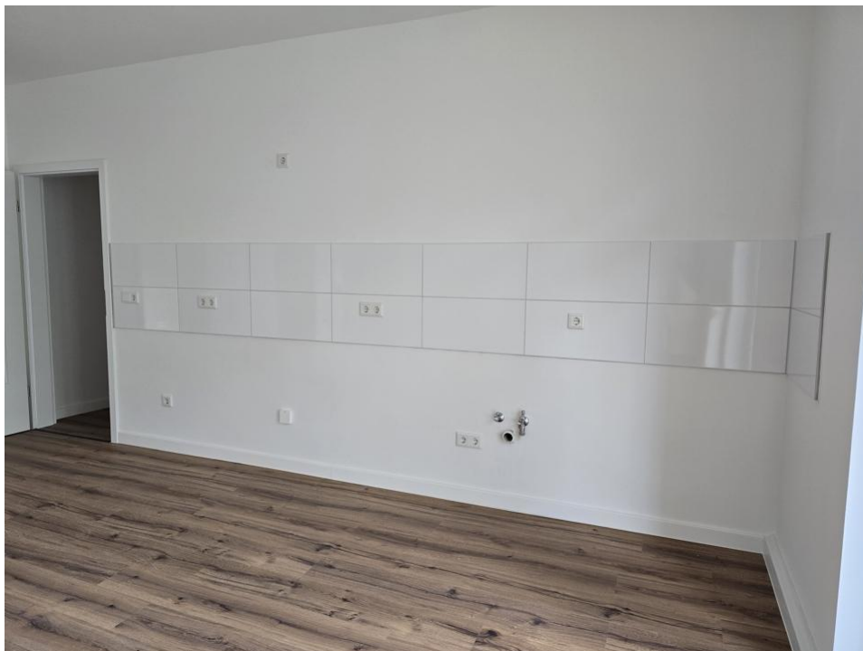
kochen und essen