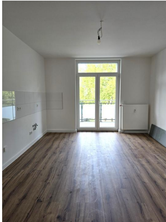
kochen und essen