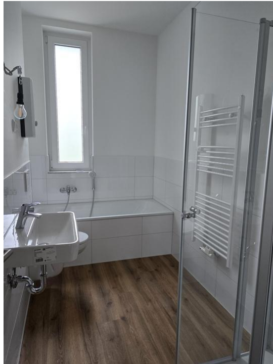
baden und duschen