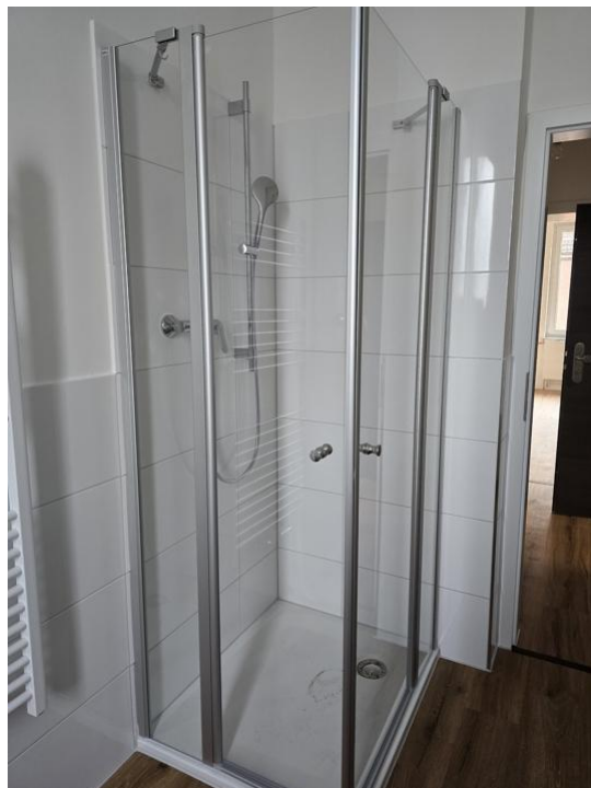
baden und duschen