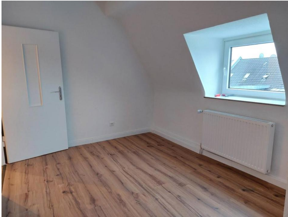
kochen und essen