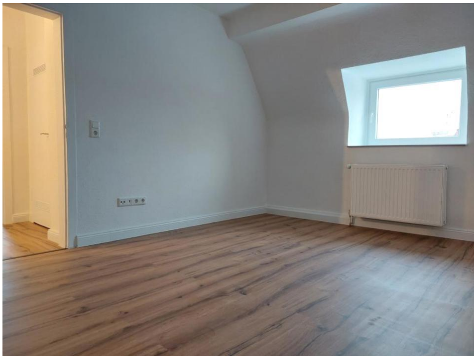
schlafen und wohnen