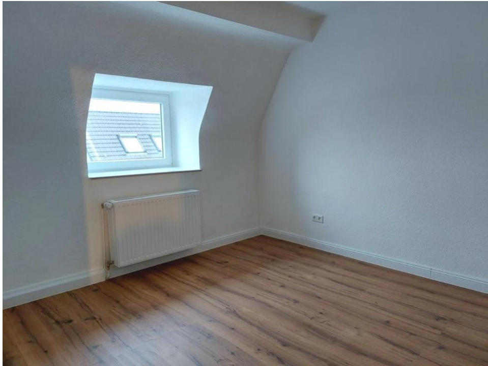
schlafen und wohnen