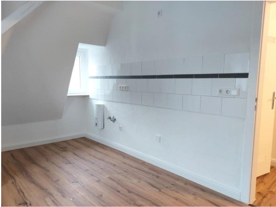
kochen und essen