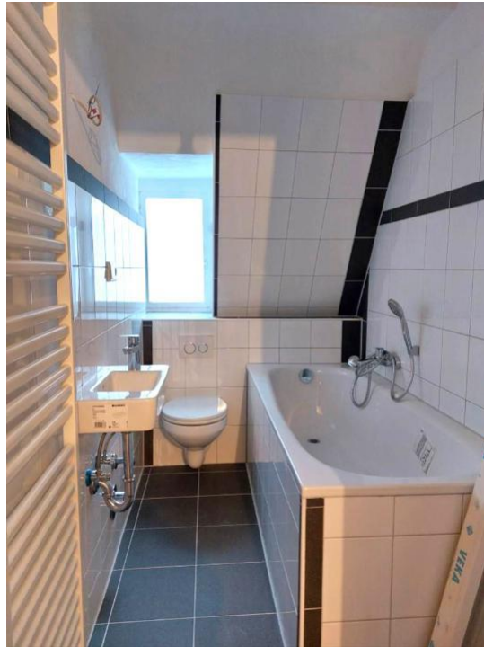
baden und pflegen