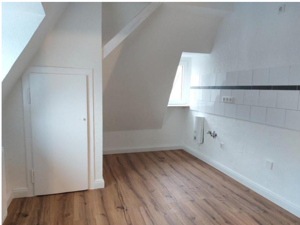
kochen und essen