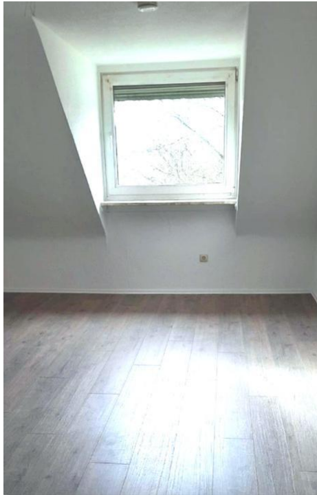
wohnen und kochen