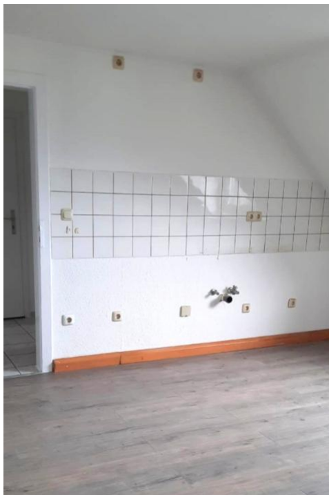
wohnen und kochen