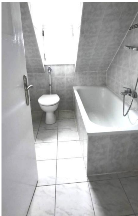
baden und pflegen