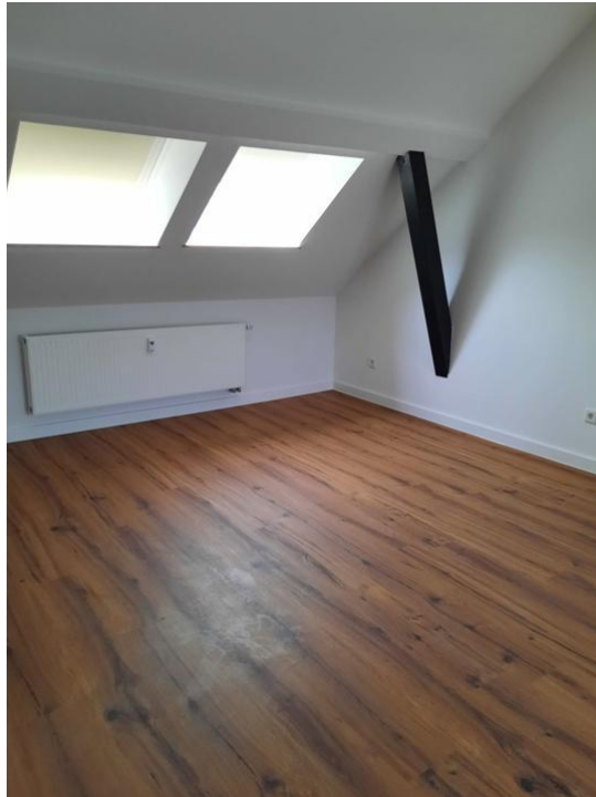
kochen und wohnen