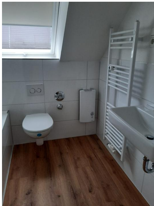
baden und pflegen