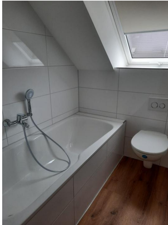
baden und pflegen