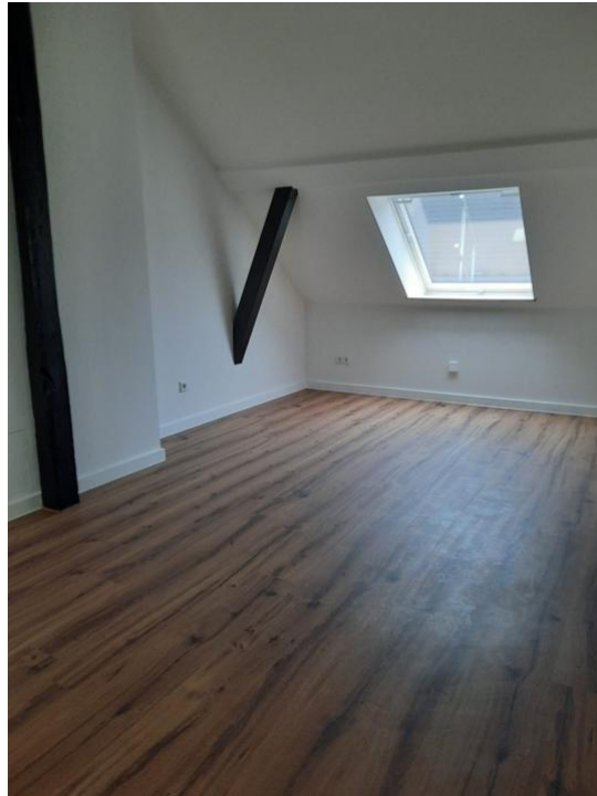
kochen und wohnen