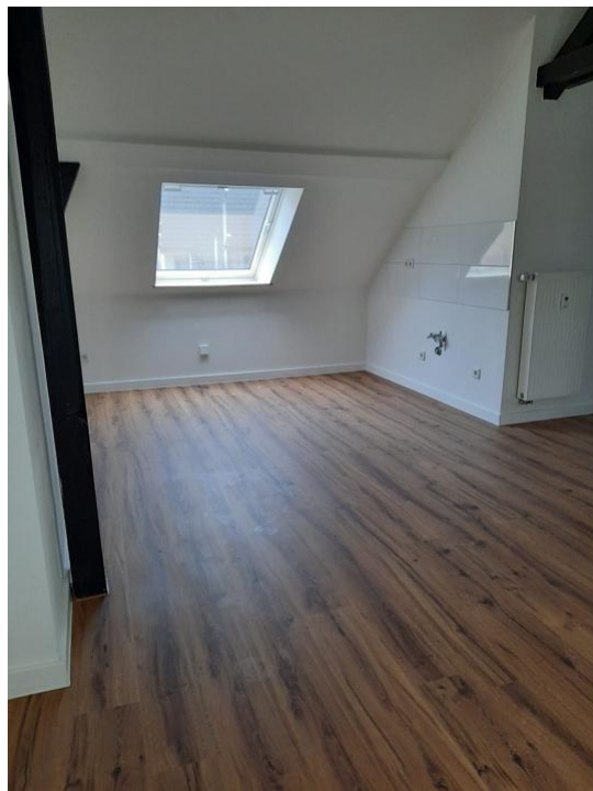
kochen und wohnen