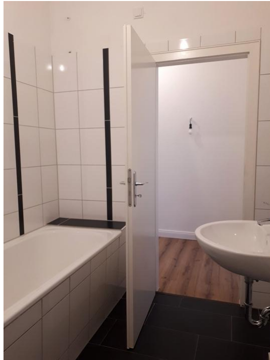
duschen und pflegen