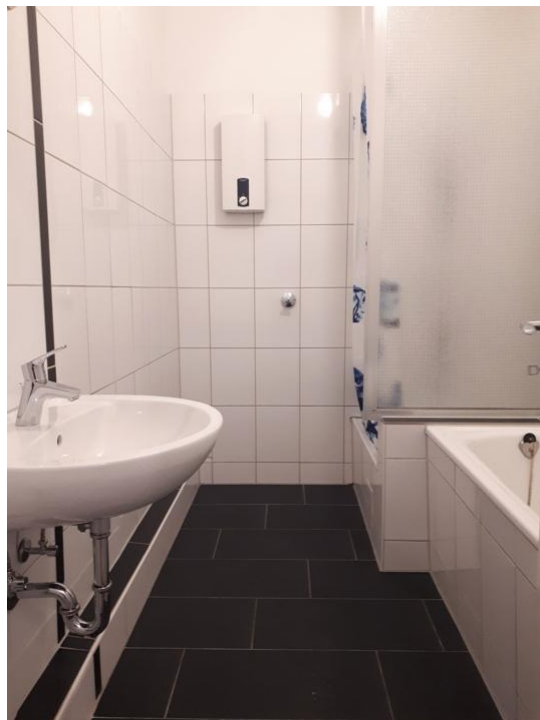
duschen und pflegen