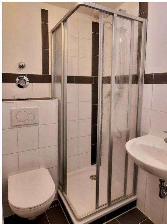
duschen und pflegen