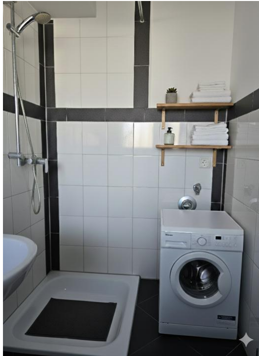
duschen und pflegen