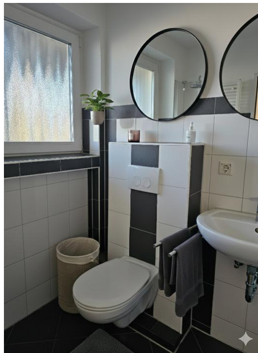
duschen und pflegen