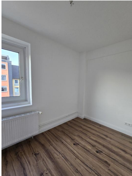
schlafen oder arbeiten