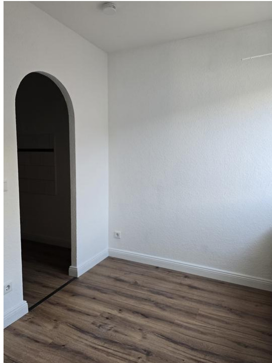
schlafen oder arbeiten