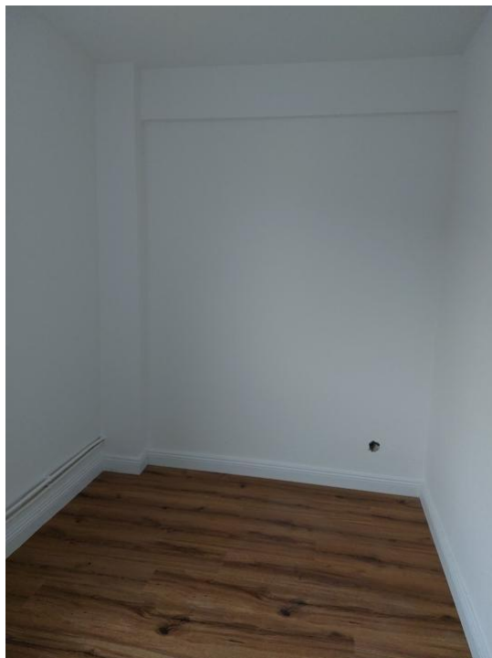
schlafen oder arbeiten