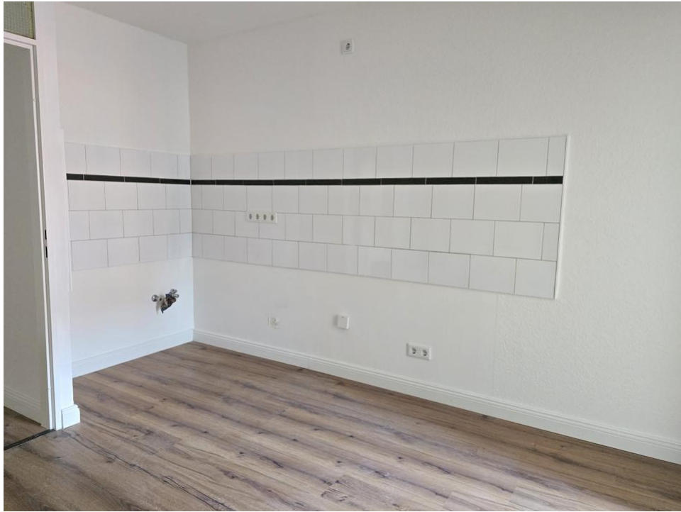
kochen und essen