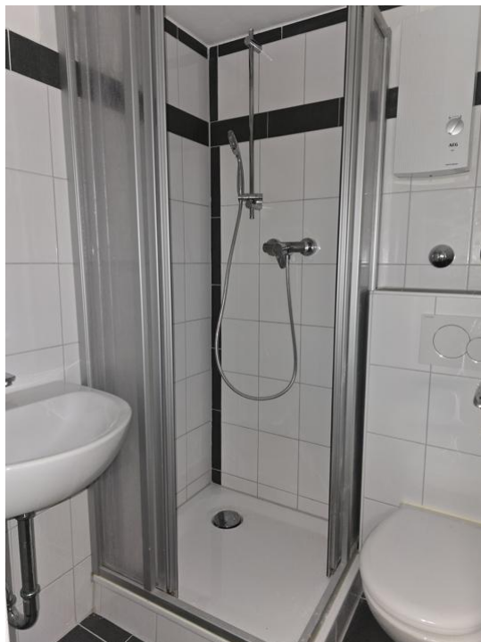
duschen und pflegen