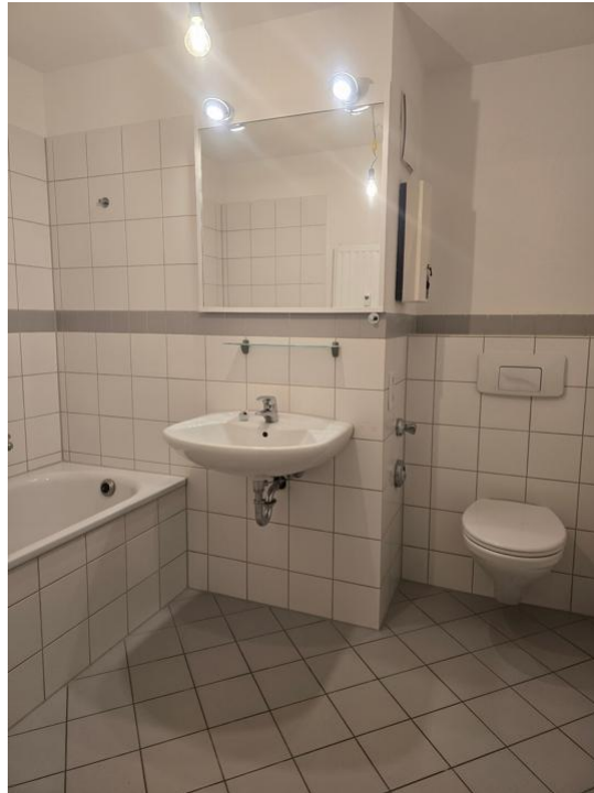
baden und pflegen