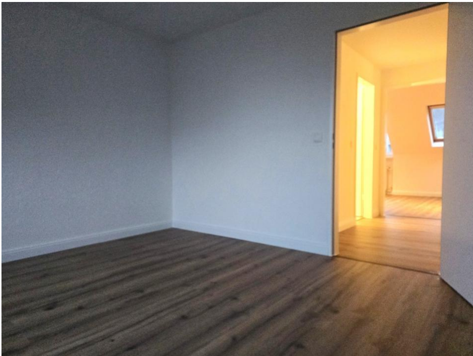
spielen oder arbeiten