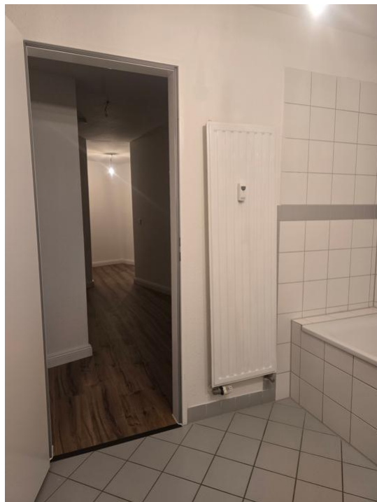
baden und pflegen