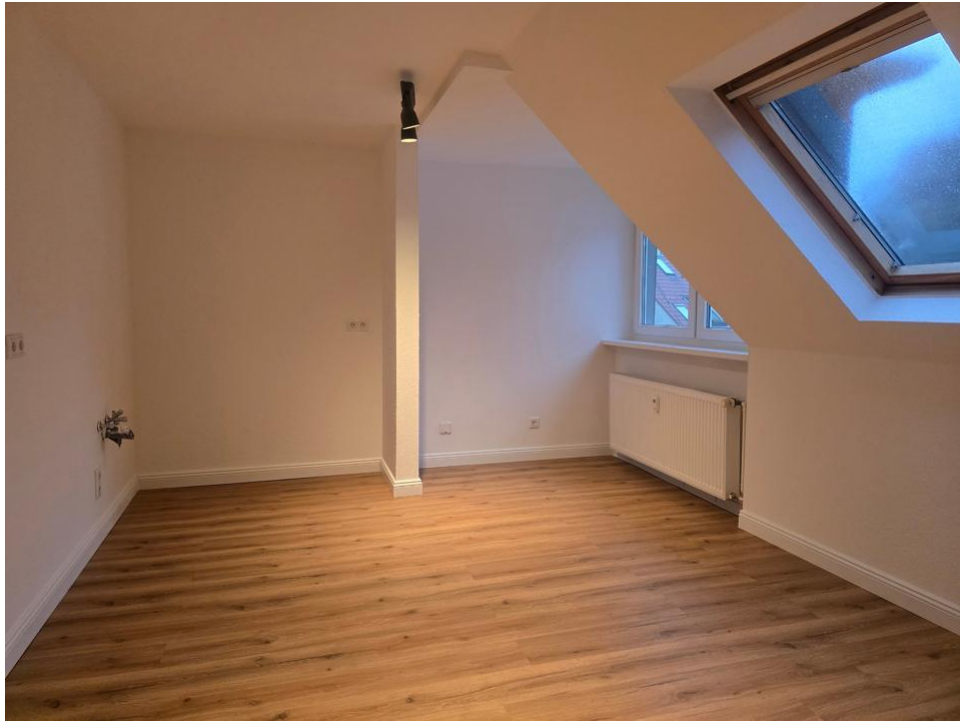
kochen und essen