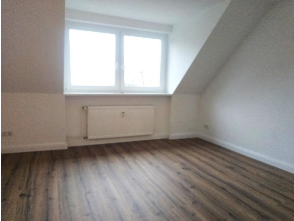
spielen oder arbeiten