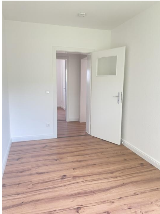
spielen oder arbeiten