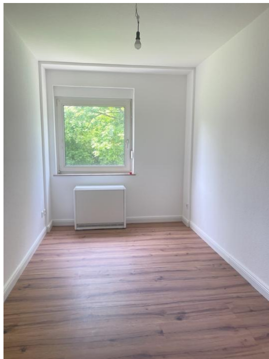
spielen oder arbeiten