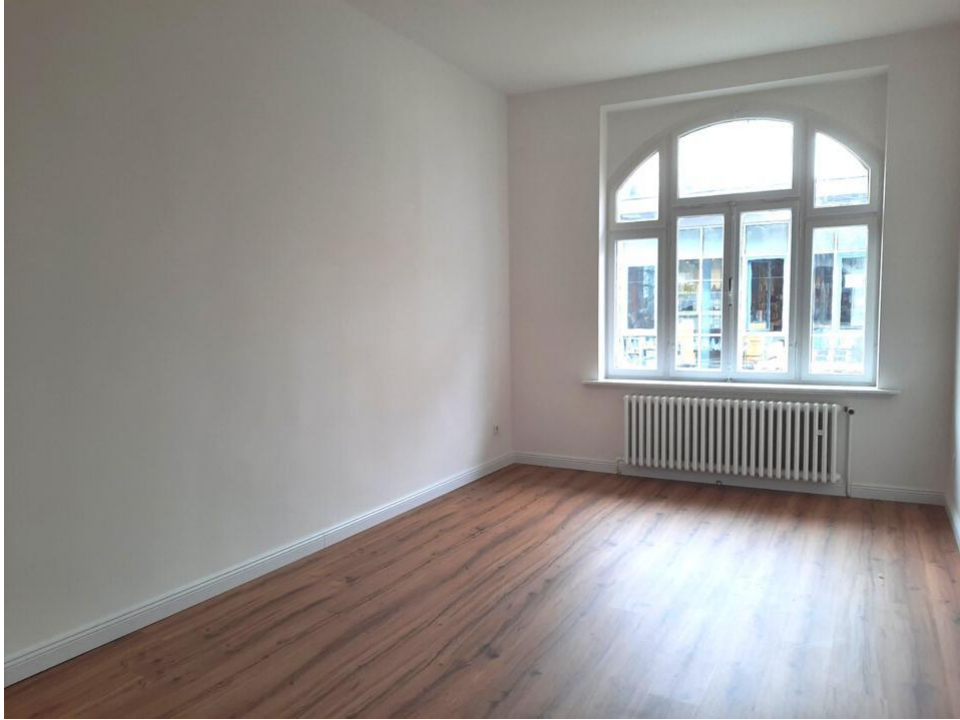
spielen oder arbeiten