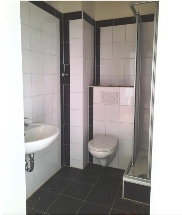
duschen und pflegen