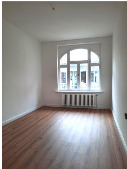
spielen oder arbeiten