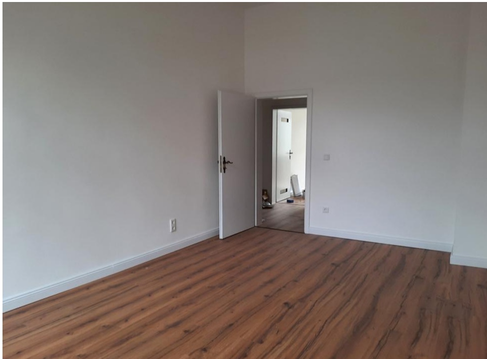
spielen oder arbeiten