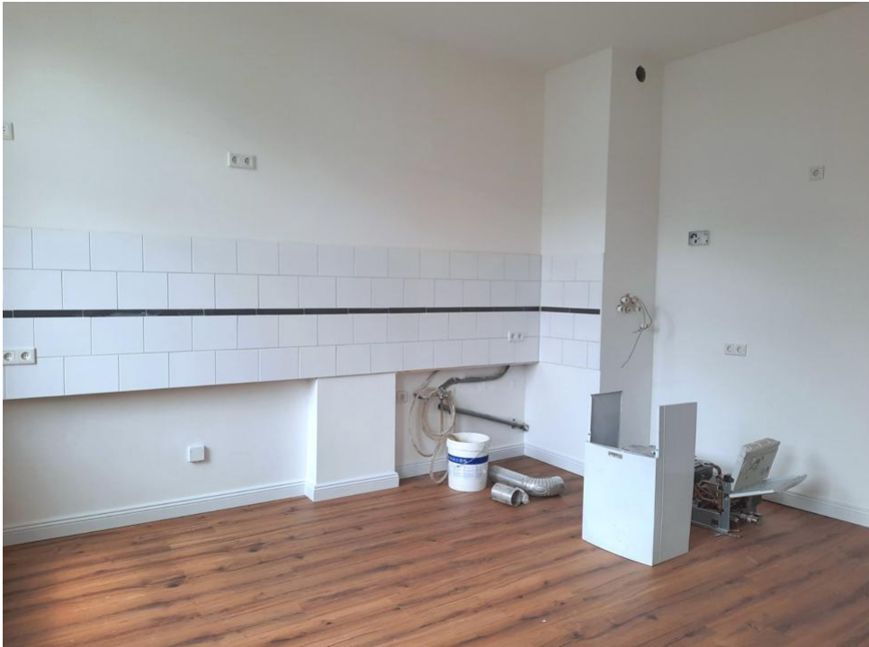
kochen und essen