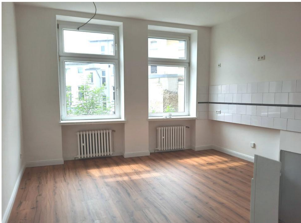
kochen und essen